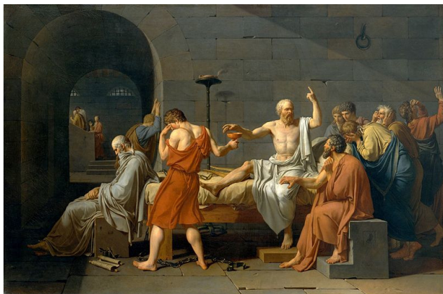
โสกราตีส (Socrates)

“ข้าพเจ้ารู้ว่า... ข้าพเจ้าเป็นคนเฉลียวฉลาด นั่นเพราะ...ข้าพเจ้ารู้ว่าอยู่เสมอว่า ข้าพเจ้าไม่รู้สิ่งใดเลย”